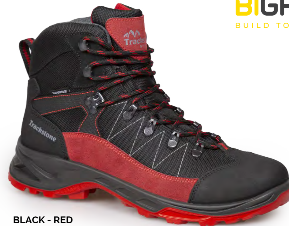
BLACK - RED