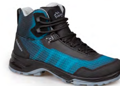
SMERALDO - BLACK