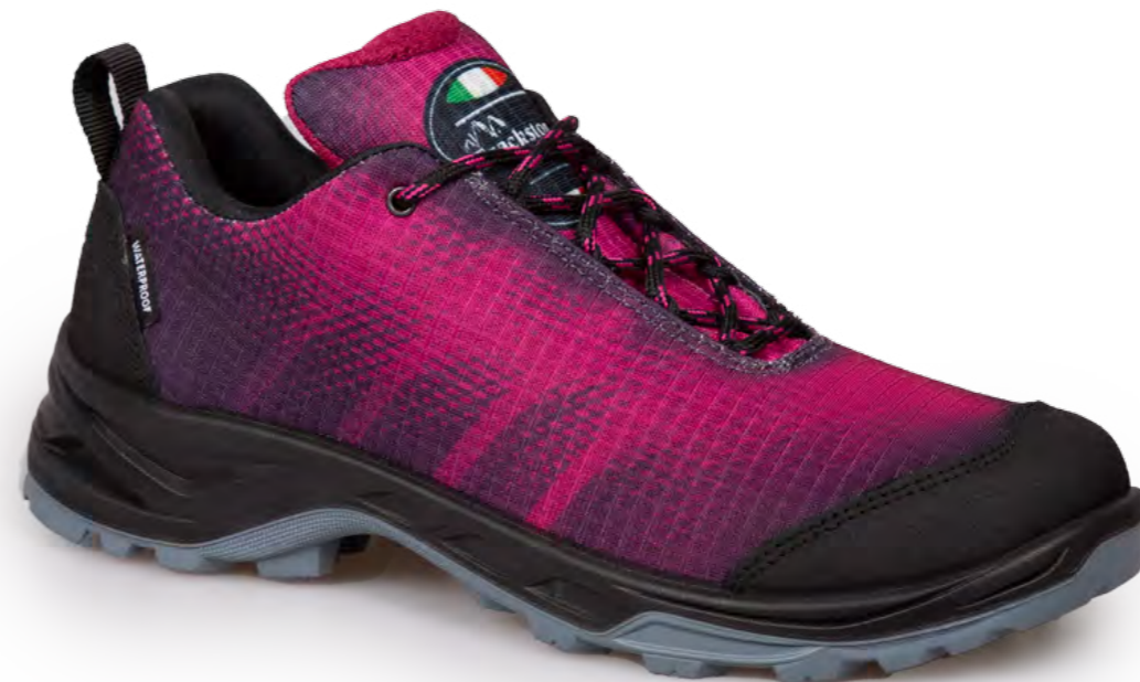
FUCHSIA - BLACK