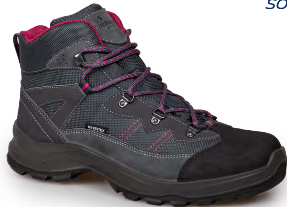
GREY BRAIN - ANTHRACITE