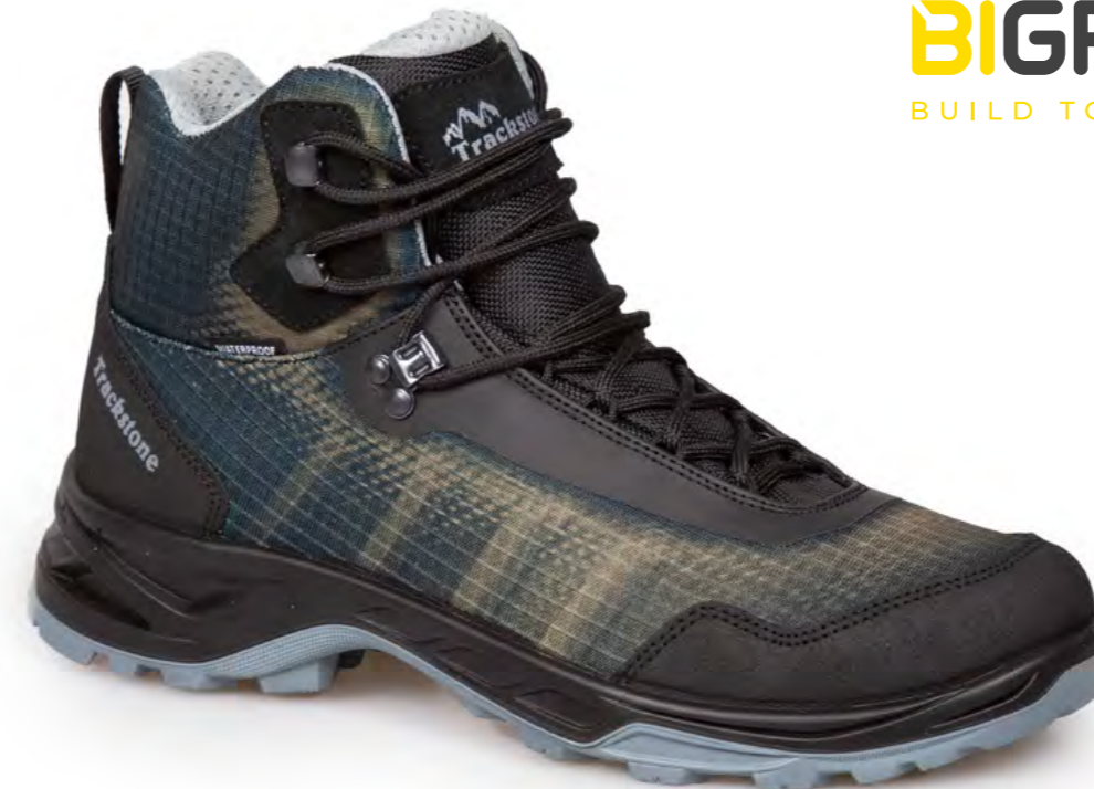
CARIBOU - BLACK