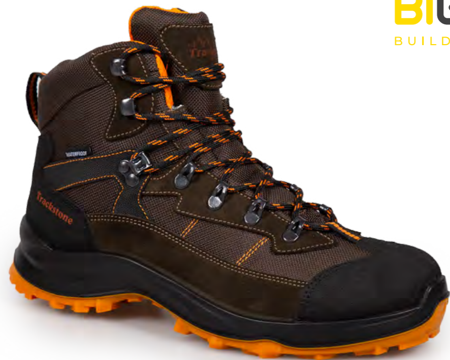
BROWN - ORANGE