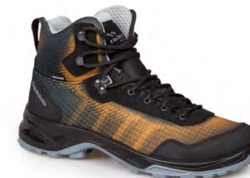
ORANGE - BLACK