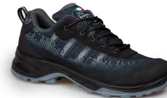
ANTHRACITE - BLACK