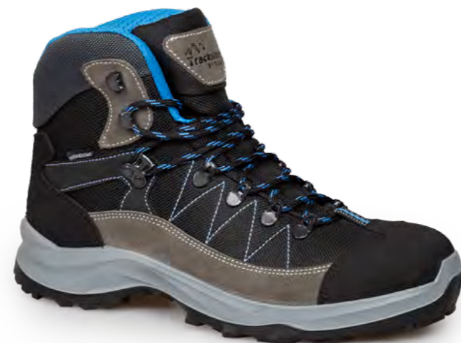
GREY BRAIN - BLACK