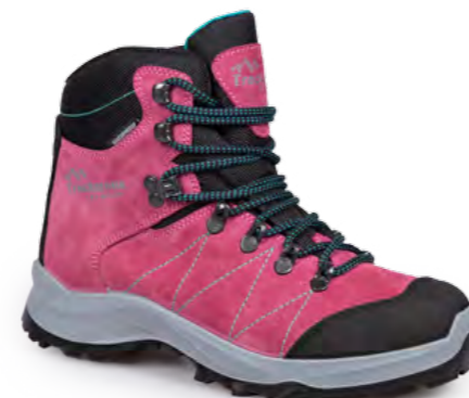
CUPCAKE - BLUETTE