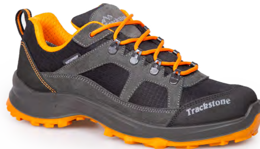
GREY SHARK - BLACK