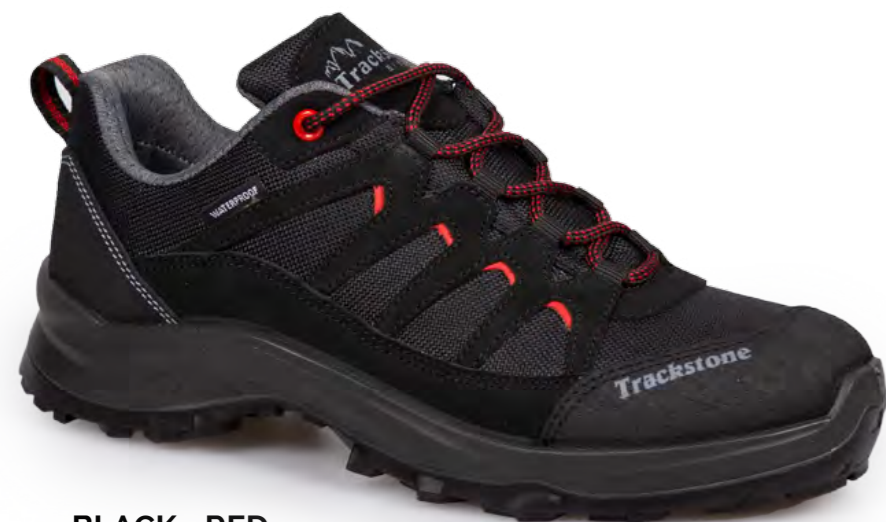
BLACK - RED