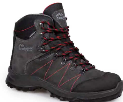
ANTHRACITE - RED