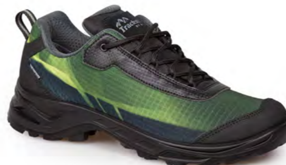
GREEN - BLACK