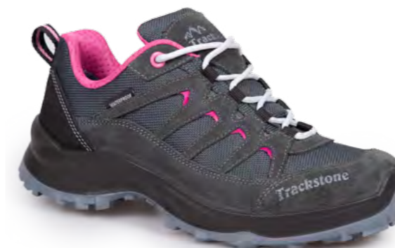
GRIGIO BRAIN - FUCHSIA