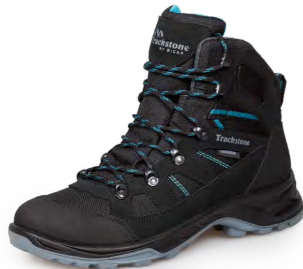
BLACK - SMERALDO