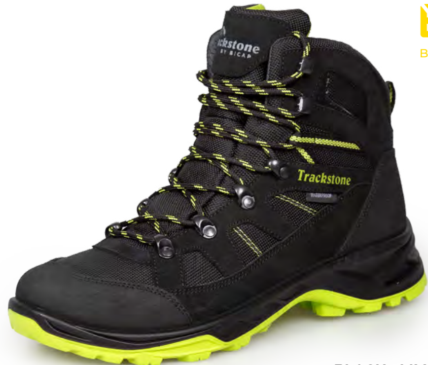
BLACK - LIME