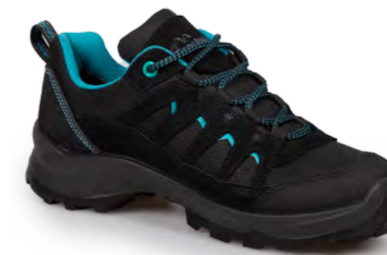
BLACK - SMERALDO