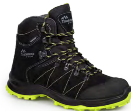
BLACK - LIME