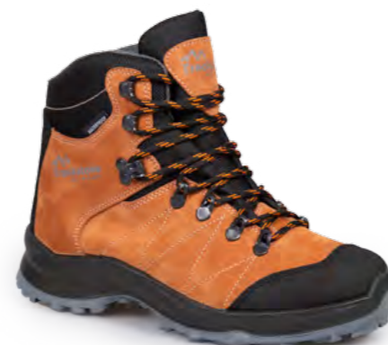
ORANGE - BLACK