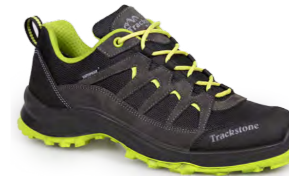
GRIGIO SHARK - LIME