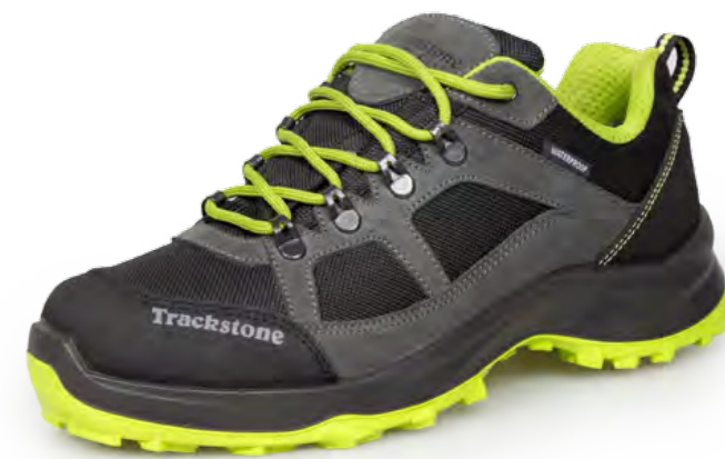
GREY SHARK - LIME