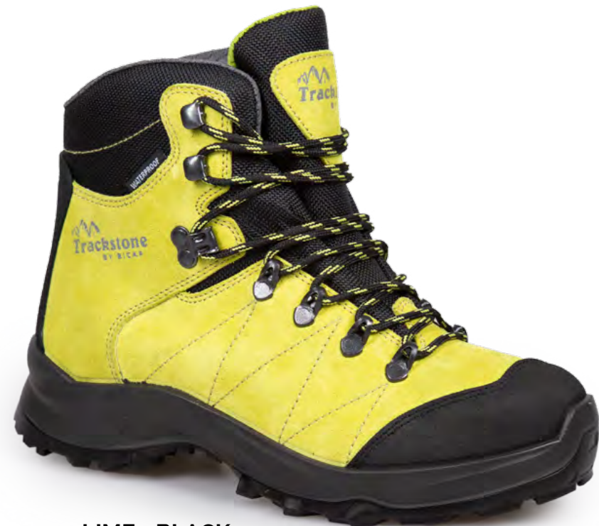
LIME - BLACK