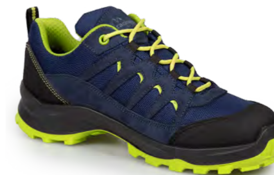
BLUE - LIME