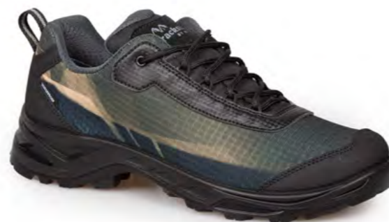
CARIBOU - BLACK