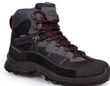
BLACK - GREY