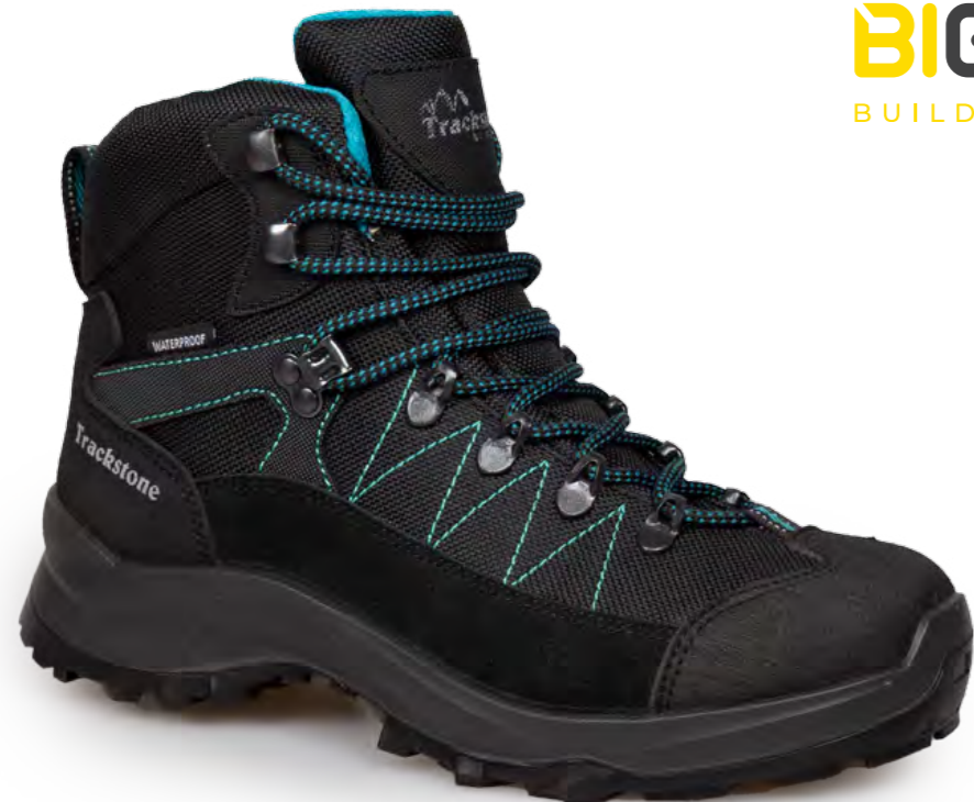
BLACK - SMERALDO