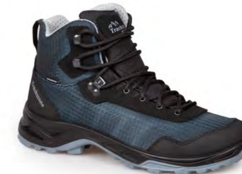
ANTHRACITE - BLACK