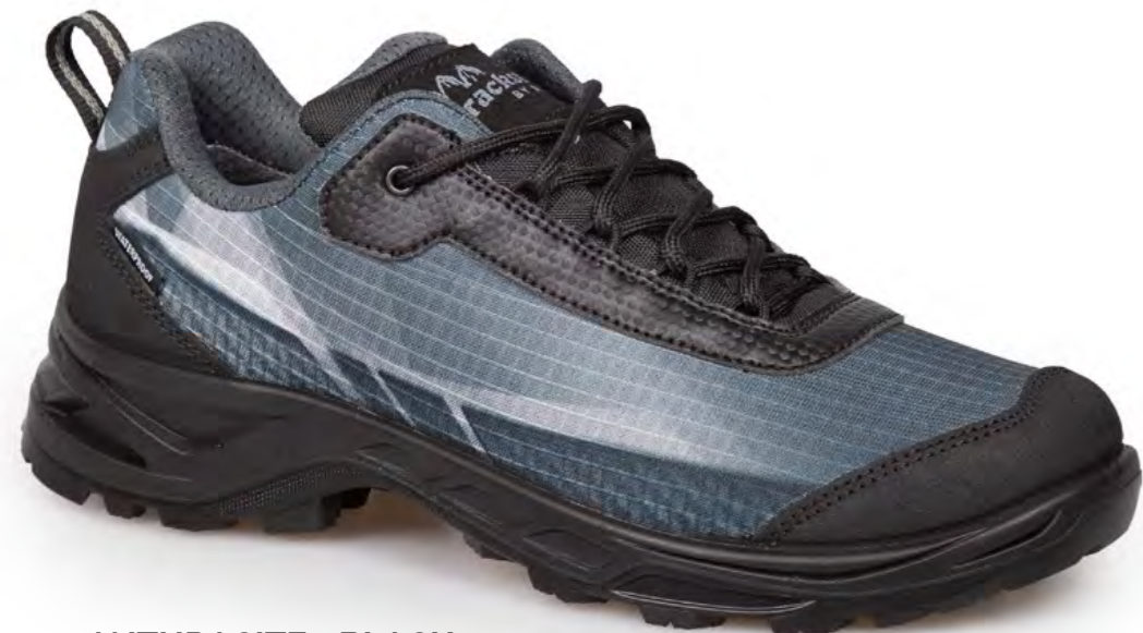
ANTHRACITE - BLACK