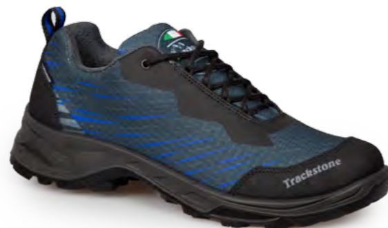
ANTHRACITE - ROYAL