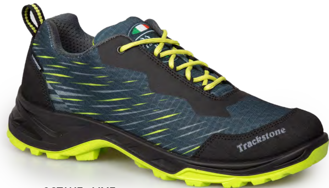
OCTANE - LIME