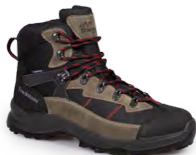
CARIBOU - BLACK