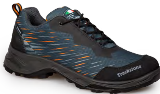
ANTHRACITE - ORANGE