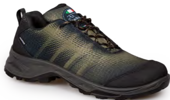
CARIBOU - BLACK