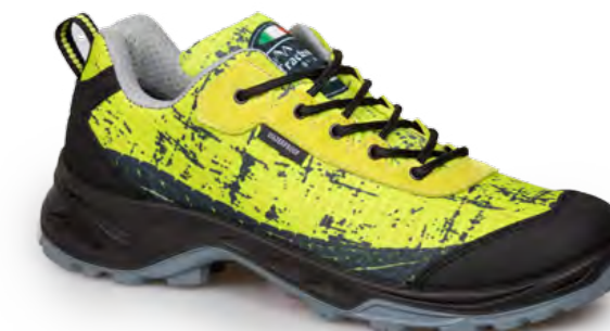
YELLOW - BLACK