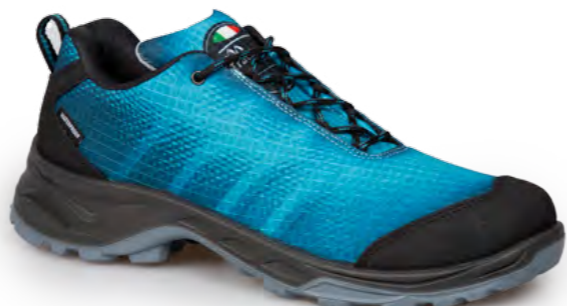
TOURQUOISE - BLACK