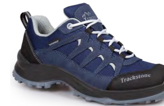
BLUE - BLACK