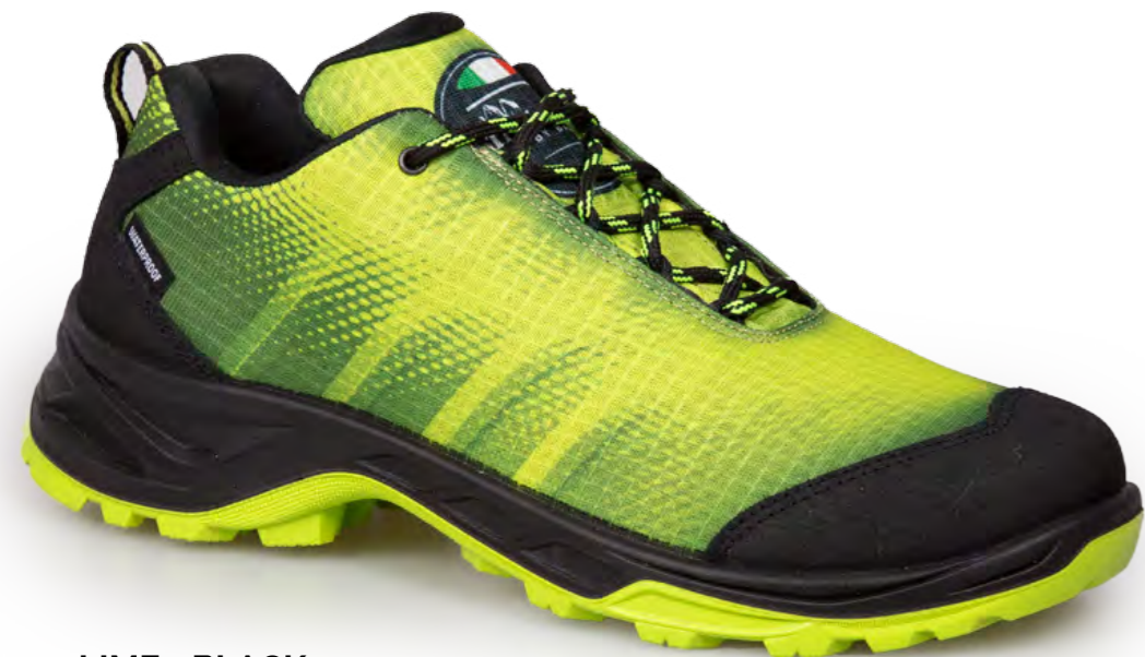
LIME - BLACK