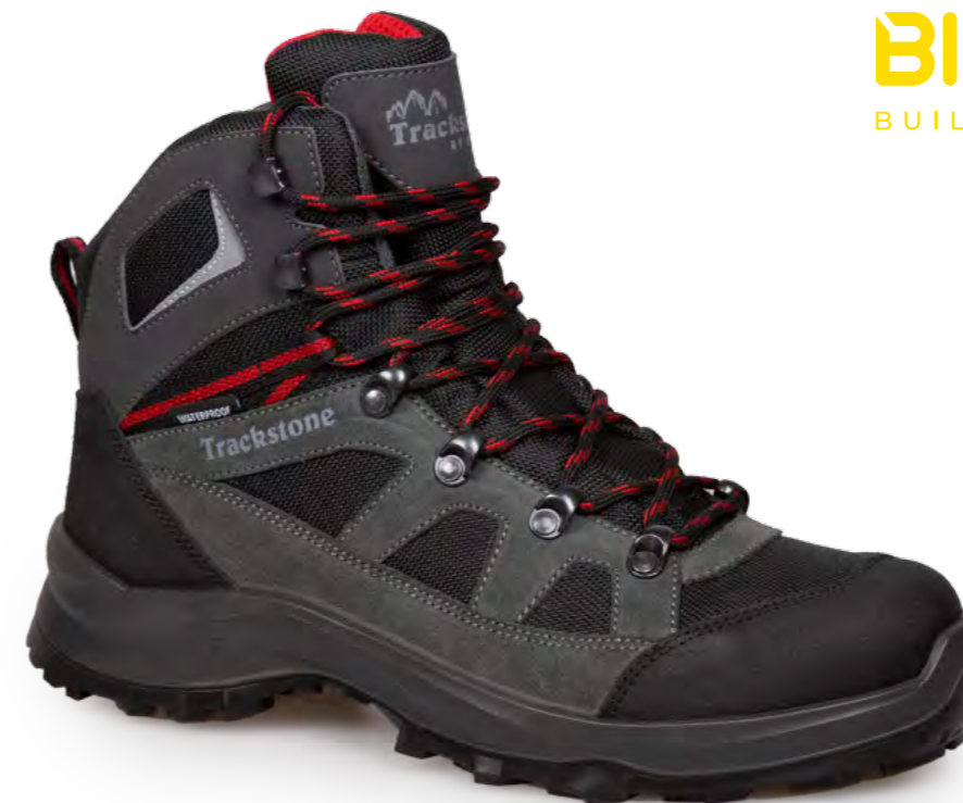
GREY SHARK - BLACK