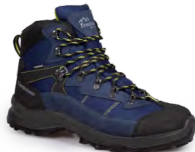
BLUE - LIME